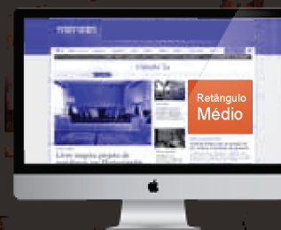
Retângulo Médio na Capa do Canal CASA&CIA de ZH.com 30 dias | 24 h | 100% de visibilidade Impressões: 17.100