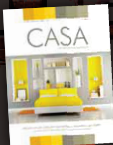
FOTO DE CAPA

Produção Fotográfica com ambiente, objetos e produtos fornecidos pelo cliente*.