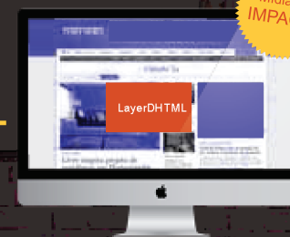
LayerDHTML na Capa do Canal CASA&CIA de ZH.com 2 diárias | 100% de visibilidade Impressões: 1.140